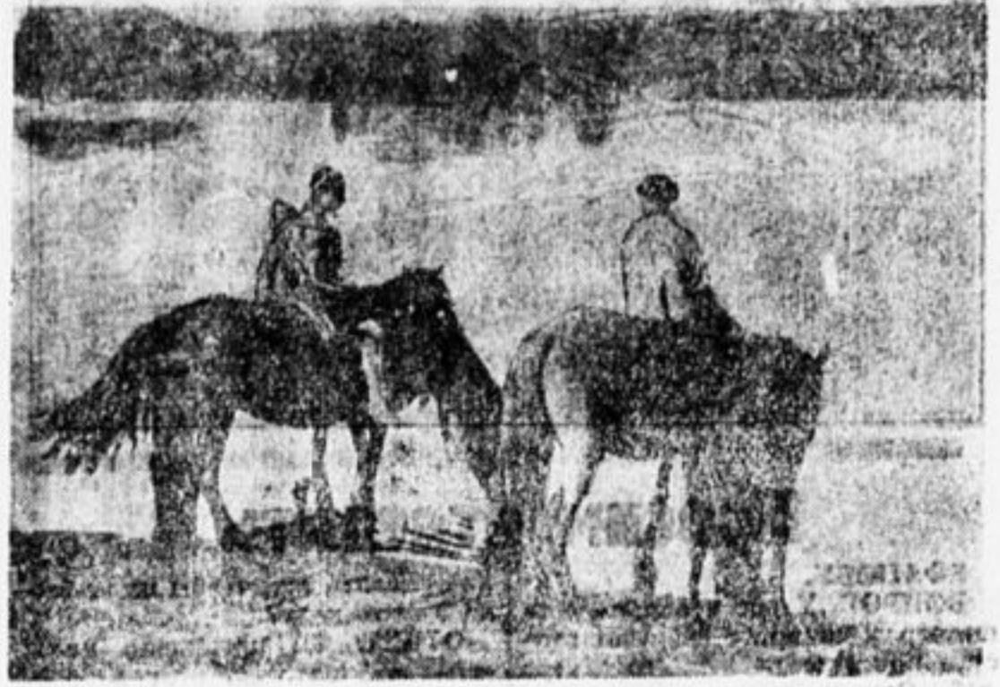
На водопое перед ночным.

Используйте ночное для объединения крестьянских ребят.